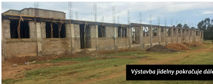
Výstavba jídelny pokračuje dále

V říjnu proběhly v Tanzanii volby. Vítězem se prohlásila vládnoucí strana v čele se stávající prezidentkou. Po volbách došlo k mnohým násilným nepokojům, které byly doprovázeny tvrdým zásahem bezpečnostních složek. Byly uzavřeny školy, na několik dnů byl odpojen internet, omezeno bylo i telefonní spojení a televizní vysílání. Přesné údaje o počtu mrtvých není možné s jistotou ověřit, protože vláda nezveřejnila oficiální statistiky a situaci ztěžoval internetový výpadek a omezení médií. Opozice hovoří o tom, že počet obětí mohl přesáhnout 1.000 osob. Po několika dnech se situace stabilizovala, přesto jsou modlitby o politickou situaci v zemi jistě velmi žádoucí.