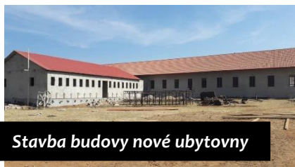
Stavba budovy nové ubytovny

Ohledně ubytování jsme tu museli řešit ještě další problém, který souvisel s požárem v jednom ubytovacím zařízení ve škole Kagera. Vláda nařídila další inspekce, které byly namátkové někdy i během noci, a tentokrát se inspektorům nelíbilo to, že v ubytovacím zařízení jsou umístěny děti ze základní i střední školy. Tento problém se dal řešit jedině tím, že přemístíme dívky do nové ubytovny, která v té době nebyla ještě hotová. Na dokončení ubytovny jsme dostali lhůtu 5 měsíců, na přestěhování děvčat další měsíc. Vše se událo v době, kdy jsme už našťástí stavěli novou ubytovnu, jen bylo třeba urychlit veškeré práce tak, aby se vše stihlo v termínu.